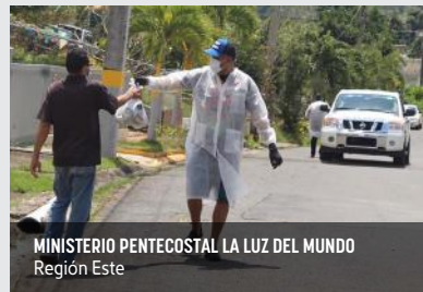
MINISTERIO PENTECOSTAL LA LUZ DEL MUNDO Región Este