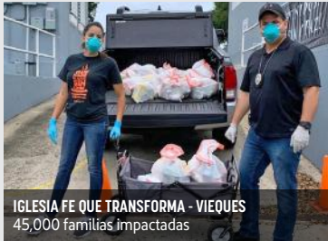
IGLESIA FE QUE TRANSFORMA - VIEQUES 45,000 familias impactadas