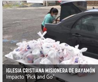
IGLESIA CRISTIANA MISIONERA DE BAYAMÓN Impacto "Pick and Go"