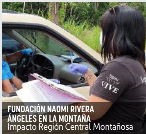
FUNDACIÓN NAOMI RIVERA ÁNGELES EN LA MONTAÑA Impacto Región Central Montañosa