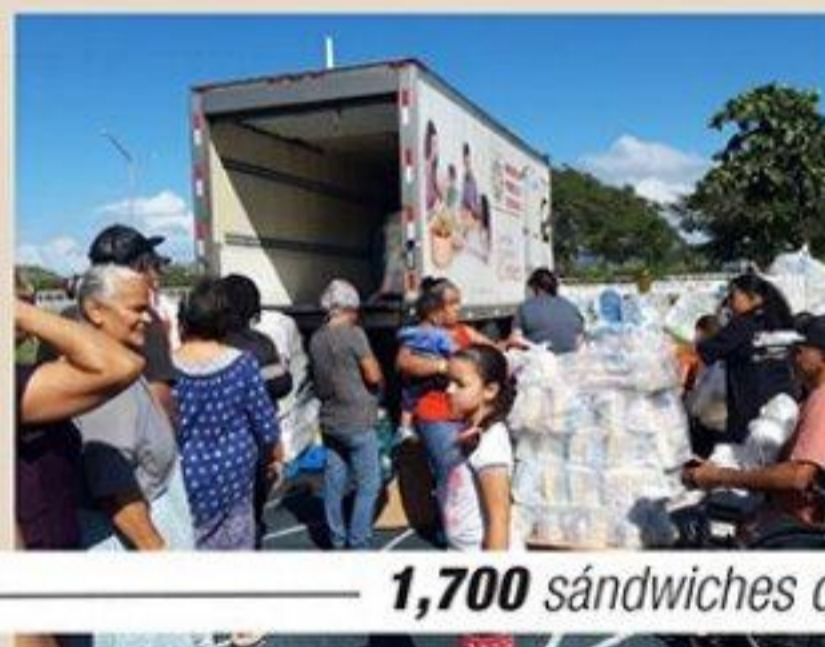
1,700 sándwiches distribuidos por Subway